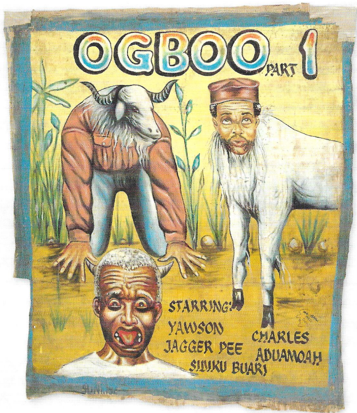
MR. BREW ARTS, TAKORADI, AFFICHE VOOR OGBOO PART 1 (GHANA), 1992. OLIEVERF OP DOEK, 197 X 117 CM. COLLECTIE M. ELSAS