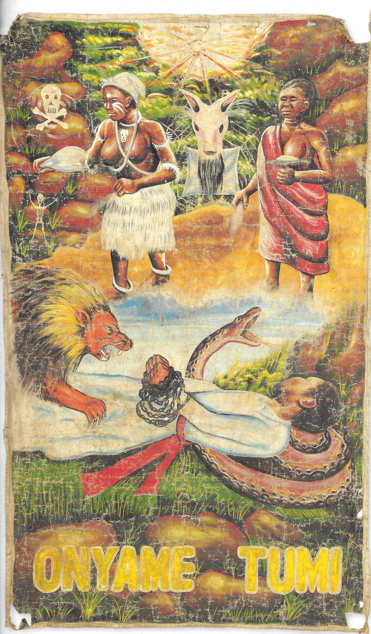
NN, AFFICHE VOOR ONY AM TUMI (GHANA, 1994). OLIEVERF OP DOEK, 172 X 103 CM, COLLECTIE M. ELSAS